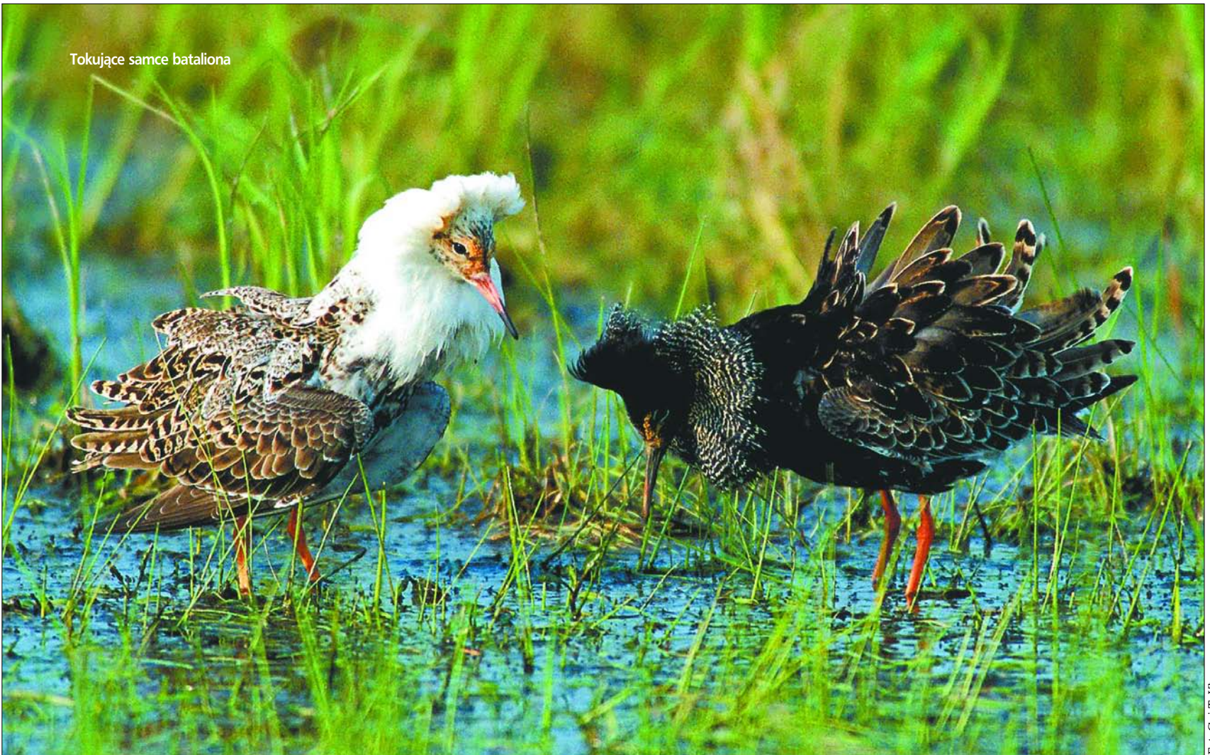
Tokujące samce bataliona