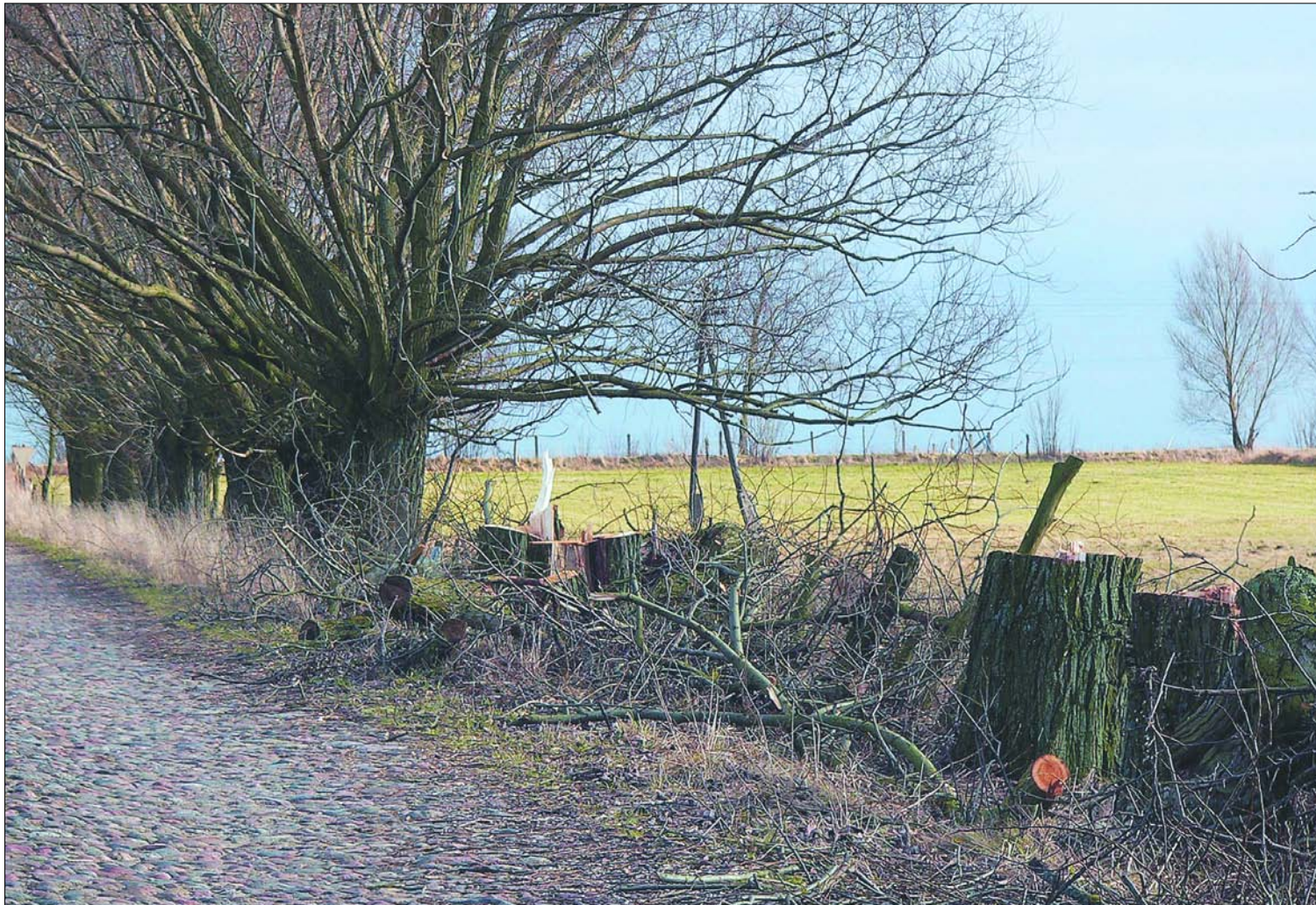
Przykład jak nie wycinać drzew. Te wierzby tworzyły piękny szpaler – tradycyjny i coraz rzadszy element rolniczego krajobrazu. Należało je tylko „ogłowić” nie naruszając pni. Za takie wycięcie grozi poważna kara

Wraz z nastaniem wiosny zabieramy się za porządki. Niejednokrotnie mogą one być związane z usunięciem drzew i krzewów. Zanim jednak zetniemy drzewo upewnijmy się, że robimy to legalnie. Wycinka drzew bez zezwolenia może kosztować nas nawet kilkadziesiąt tysięcy złotych.