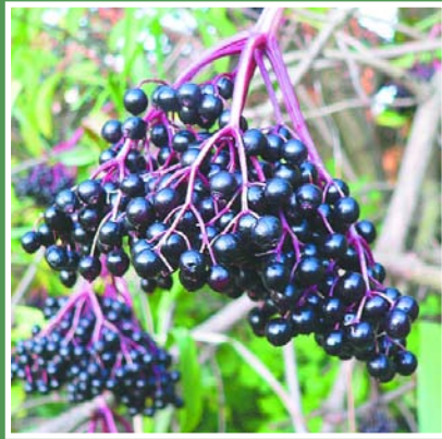
Owoce bzu nie tylko ładnie się prezentują ale zimą są atrakcyjną stołówką dla ptaków

Warto zastanowić się, na czym będą polegały nasze ogrodowe porządki. Może, po srożej zimie, trzeba będzie rozstać się z wrażliwymi na mróz roślinami i zamienić je na nasze, rodzime gatunki krzewów? Oto kilka propozycji.