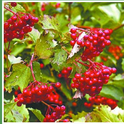
Owoce kaliny niczym korale zdobią ogród jesienią

się z końcem wakacji, a tym samym pójściem do szkoły. Jarzęby pospolite rosną w całej Polsce – przy drogach, na miedzach, w lasach.